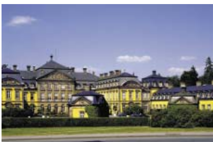
Residenzschloss Bad Arolsen

Die Hochsauerland-Höhenstraße führt Sie weiter durch die schönsten und aussichtsreichsten Ecken des Rothaargebirges mit seinen durchschnittlich 600 - 700 m hohen Gipfeln. Erleben Sie die vielfältige Schönheit eines der größten geschlossenen Waldgebiete Deutschlands.