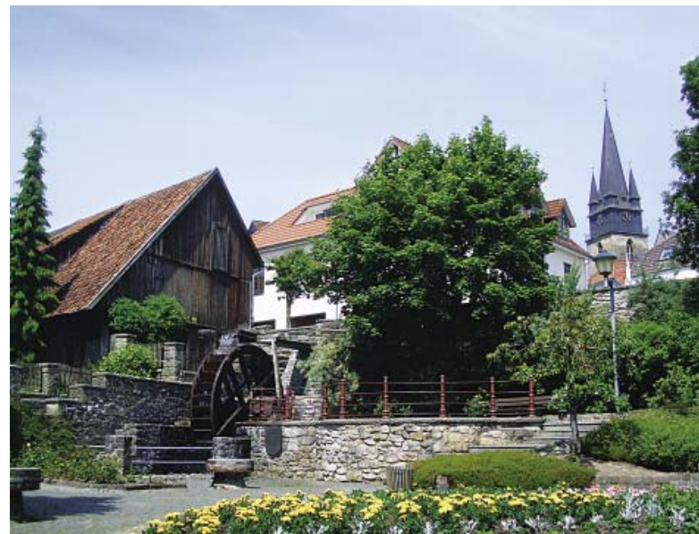
Mühlenrad, Bad Driburg

In Höxter ist die ehemalige Benediktinerabtei aus dem Jahre 822 - heute Schloss Corvey - mit dem