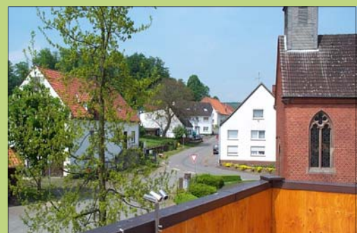
Blick vom Balkon