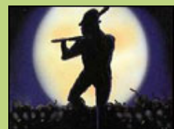
Rattenfänger von Hameln